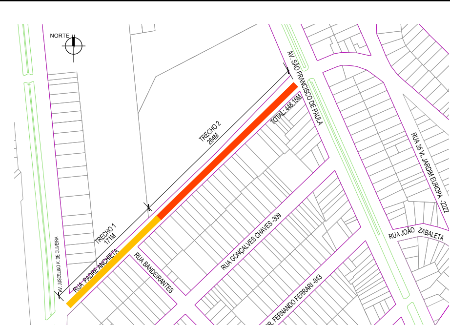
PLANTA SITUAÇÃO ESC. 1:5000